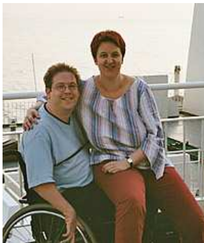
Die Initiatorin des Projektes mit ihrem Mann

"Eine Beziehung mit einem behinderten Partner funktioniert nicht anders als mit einem nichtbehinderten Partner. Doch aus Unwissenheit können sich viele so etwas nicht vorstellen", erklärt die Bonner Journalistin, die selbst mit einem behinderten Partner verheiratet ist.